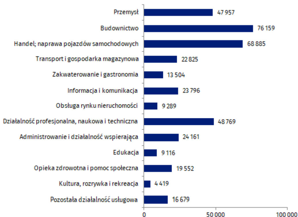
Wykres 1. Liczba pracujących w przedsiębiorstwach powstałych w 2019 r. i aktywnych do 2020 r. według sekcji PKD

Ze względu na rodzaj prowadzonej działalności najwięcej osób pracowało w przedsiębiorstwach jednorocznych z sekcji budownictwo (76 159 osób) oraz handel; naprawa pojazdów samochodowych (68 885 osób).