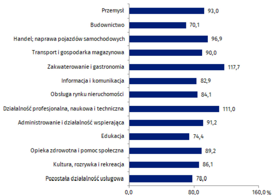
Wykres 3. Wskaźnik poziomu kosztów w przedsiębiorstwach powstałych w 2019 r. i aktywnych do 2020 r. według sekcji PKD

Wskaźnik poziomu kosztów przedsiębiorstw niefinansowych jednorocznych wyniósł 90,8%