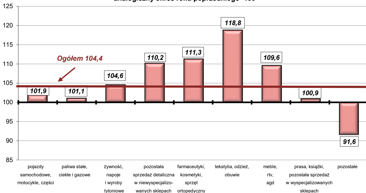
SPRZEDAŻ DETALICZNA TOWARÓW W LIPCU 2016 R. (ceny stałe) analogiczny okres roku poprzedniego=100

W okresie styczeń –lipiec br. wzrost sprzedaży detalicznej w skali roku wyniósł 5,1% (wobec wzrostu o 3,7% w 2015 r.).