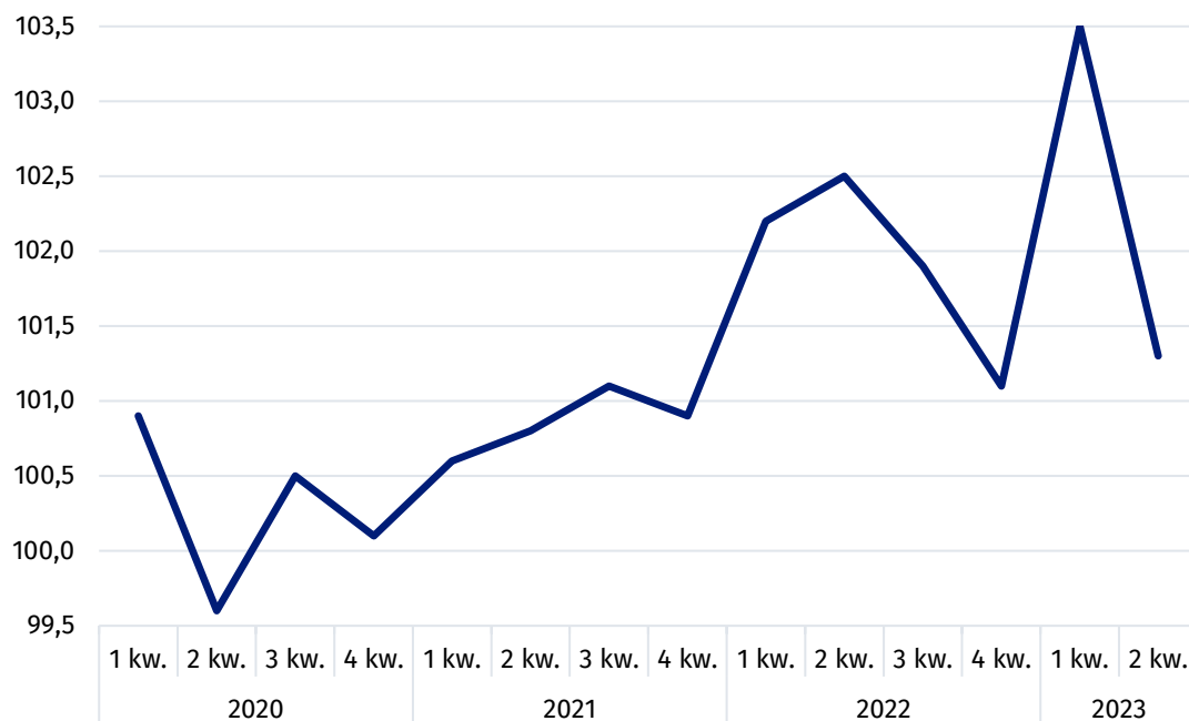
Wykres 2. Zmiany cen producentów usług związanych z obsługą działalności gospodarczej w latach 2020-2023 (analogiczny okres roku poprzedniego = 100)